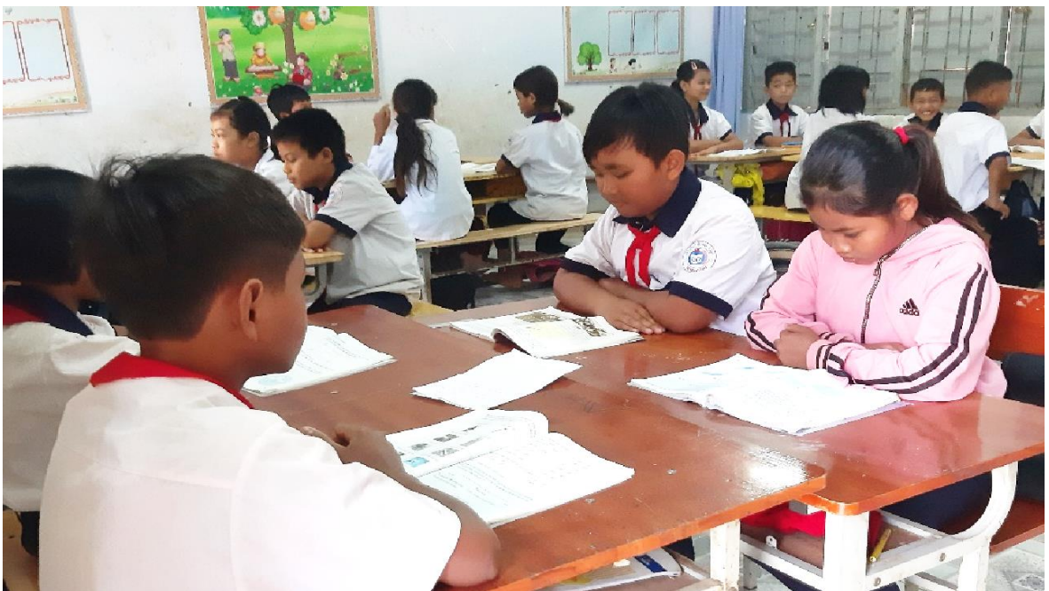
Học sinh ngồi theo nhóm sở thích

Ví như khi tập trung theo nhóm sở thích chẳng hạn, học sinh thích hát/vẽ/ đóng kịch... vào một nhóm các em có cơ hội cùng trao đổi, tổ chức hoạt động của mình theo đúng sở trường sẽ đạt kết quả cao hơn. Các em cùng buồn; gần nhà ở cũng có thể xếp cùng một nhóm, các em có cơ hội tương tác