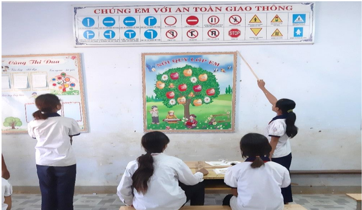
Học sinh thảo luận về chủ đề “An toàn giao thông”