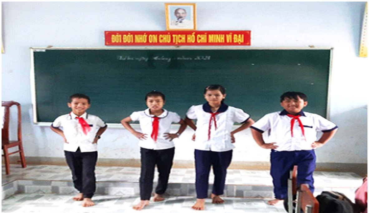
Học sinh chơi trò chơi tập thể

Cùng nhau xem các đoạn phim tư liệu lịch sử hay chuyên thể từ tác phẩm văn học nổi tiếng; chương trình ý nghĩa của “Quà tặng cuộc sống” ; những câu chuyện ngụ ngôn ngắn hay chủ đề “An toàn giao thông” ; “Tâm lý học đường” .v.v... Cùng thảo luận, tìm hiểu và chia sẻ bài học (Giao tiếp và hợp tác; Giải quyết vấn đề và sáng tạo, Năng lực đặc thù ngôn ngữ). Qua hoạt động học sinh học cách giữ bình tĩnh, tôn trọng đối phương. (Cần lưu ý để các cuộc thảo luận sa vào cãi vã). Có tiết cung cấp “nhân tố dinh dưỡng” bằng các trò chơi để phát triển cả trí tuệ lẫn thể chất học sinh (Năng lực đặc thù: thể chất). Khi lại đưa các em trải nghiệm để hiểu biết hơn về thiên nhiên, con người, cuộc sống muôn nơi qua màn ảnh nhỏ (Năng lực tìm hiểu tự nhiên và xã hội).