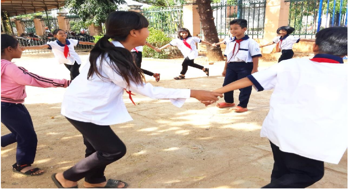
Tiết sinh hoạt lớp tổ chức ngoài sân trường