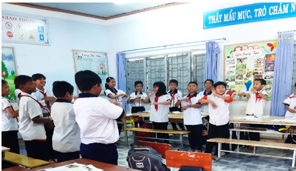
Học sinh sinh hoạt văn nghệ

Giao giữa hai hoạt động tôi lồng ghép trò chơi tập thể hay thể hiện tiết mục văn nghệ (bản thân tôi cũng tham gia), tạo không khí phấn khởi, bớt căng thẳng, nặng nề đồng thời khích lệ thành tích tốt của tuần trước.