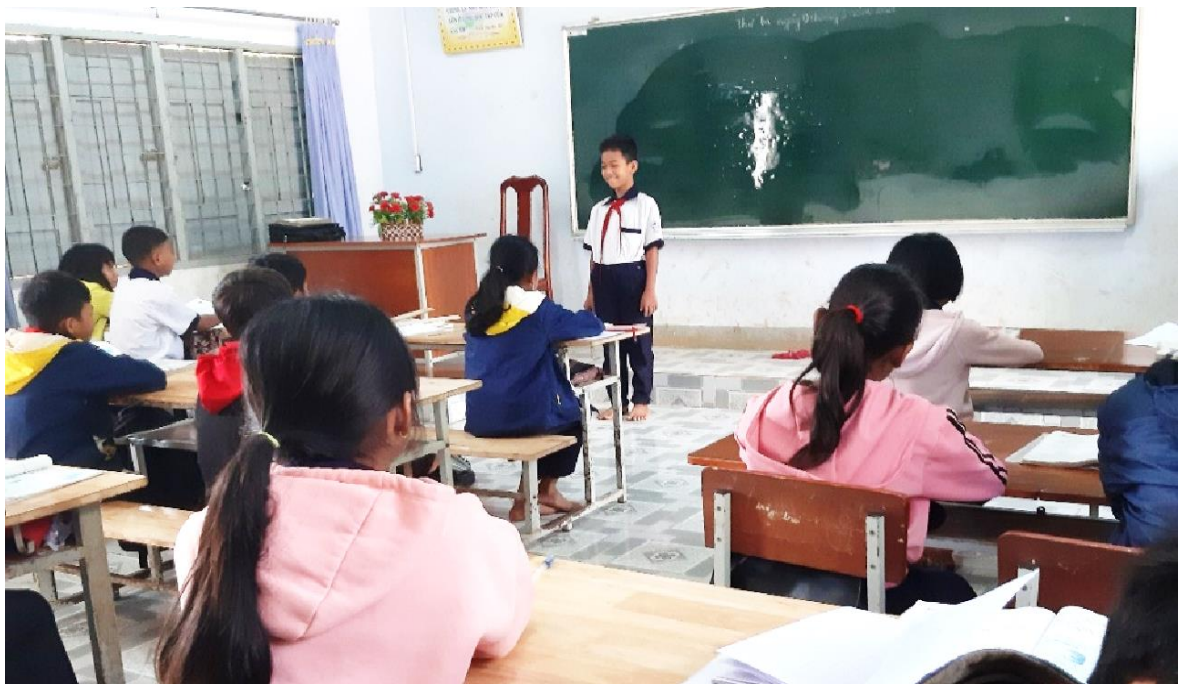
Ban cán sự lớp điều hành tiết sinh hoạt cuối tuần

Giáo viên chủ nhiệm lớp cần tránh tư tưởng quá chuyên quyền dẫn đến học sinh không được trình bày/ bộc lộ ý kiến trong tiết sinh hoạt lớp nói riêng và tất cả các hoạt động giáo dục khác. Học sinh phải là những chủ nhân thực sự, tự chủ trong các hoạt động của tiết sinh hoạt lớp. Các em vừa là “ diễn viên ” được làm chủ “ sân khấu ” mà cùng hợp tác với giáo viên chủ nhiệm trong khâu dựng “ kịch bản ” cũng như làm “ đạo diễn ” góp phần phát triển phẩm chất chăm chỉ và trách nhiệm. Chúng cần được nói, được hỏi, được